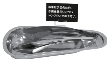
トングホルダークリップ (NO-20) (JJ-12) (519803TR)