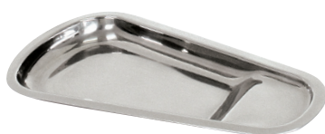
Server Holde サーバーホルダー(ST,ST) JJ-12 ¥2,400 265×148×20mm(H) 18-8

※スーパーコート製のラベルステッカーは水性ペンor チョークマーカーで、くり返し書き消しできます。(油性 ペンで書くことは出来ませんが、消すことは出来ません)