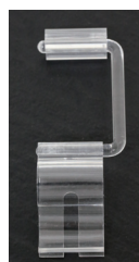
Multi Angle Ticket Clip メニューカードクリップ 519803TR 65×35mm ¥200

※カードは貴社でご用意いただくか又は(D)～(G)のトングホルダー用POPをご参照下さい。