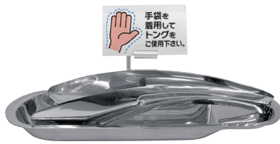
トングホルダークリップ (NO-20) (JJ12-1) (519803TR)

※カードは貴社でご用意いただくか又は(D)～(G)のトングホルダー用POPをご参照下さい。